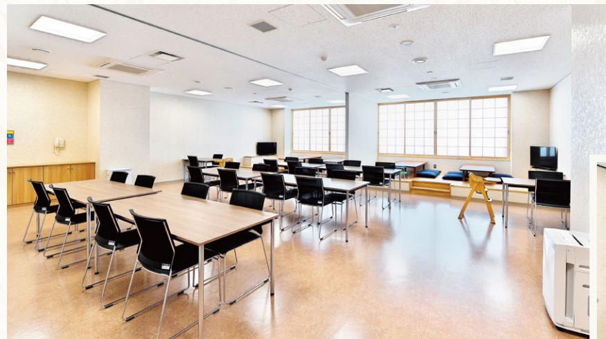
待合室[4室] 可動式パーテーションにより 大人数の会葬者にも対応します