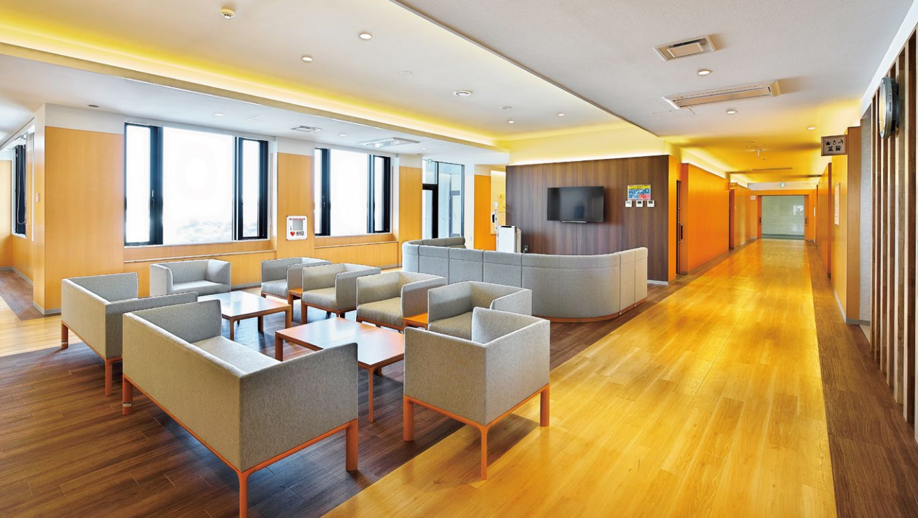
待合ホール 誰もが安心して利用できるバリアフリー対応の快適空間(キッズルームや授乳室などを併設しています)