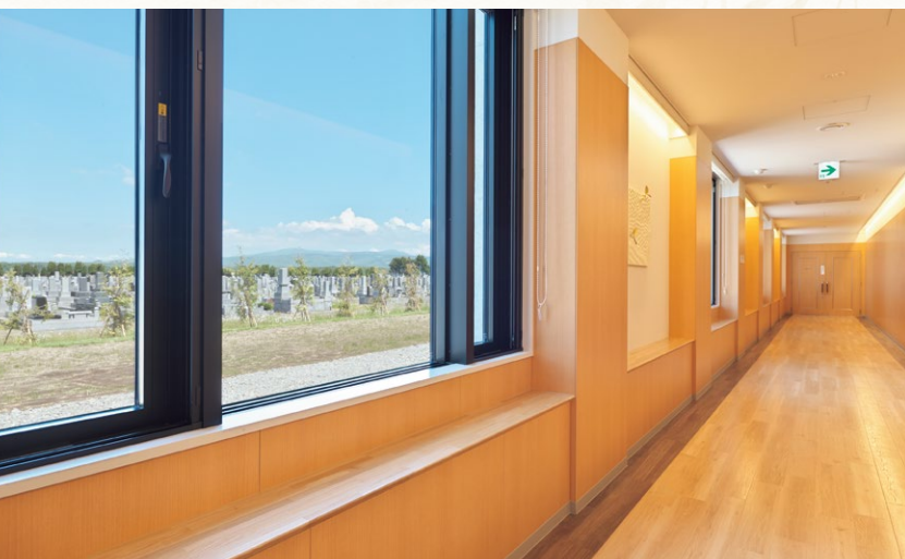
心落ち着く静寂といたわりの空間