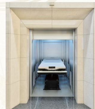
冷却前室 棺を納めるときに火葬炉の内部が 見えない構造で心情に配慮します