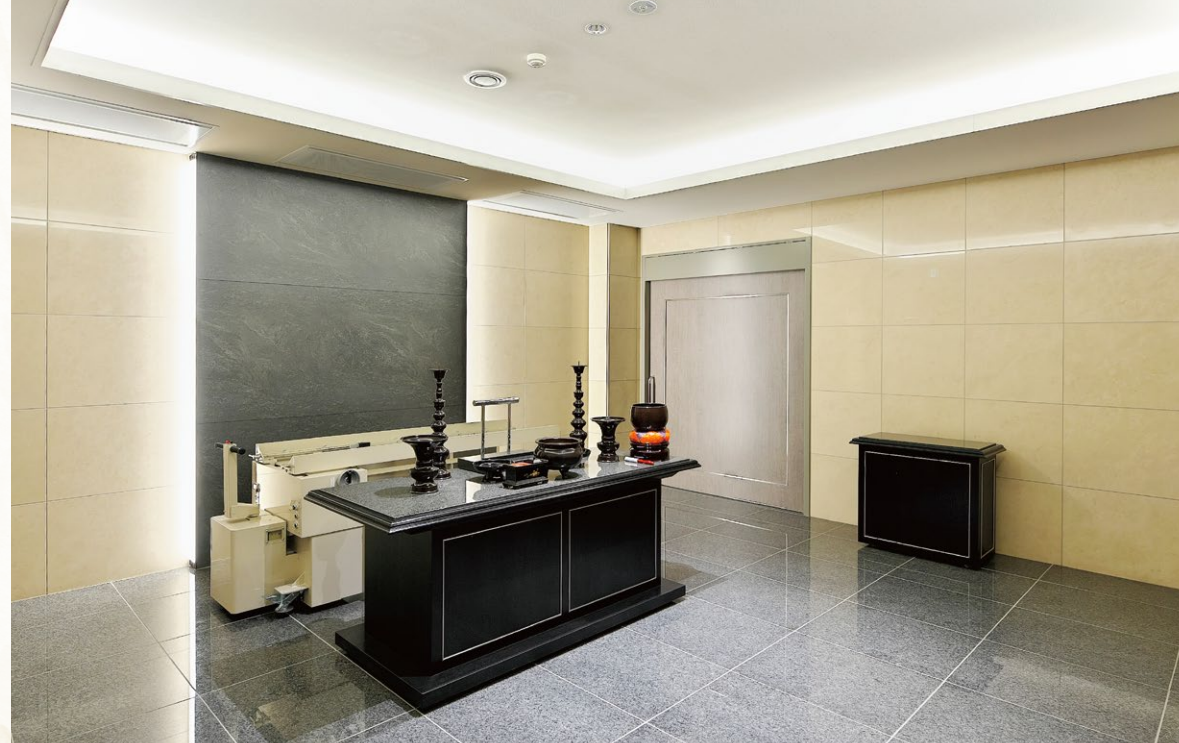
告别室 兼 収骨室 [2室] 開放的な空間とやさらかな彩光が粛々と時を刻みます